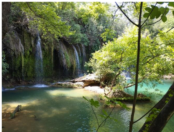
Perge ókori színháza és a Kursunlu vízesés

Összegzésében nagyon hasznos és kellemes egy hetet töltöttünk Antalya-ban, ill. az Akdeniz Egyetemen.