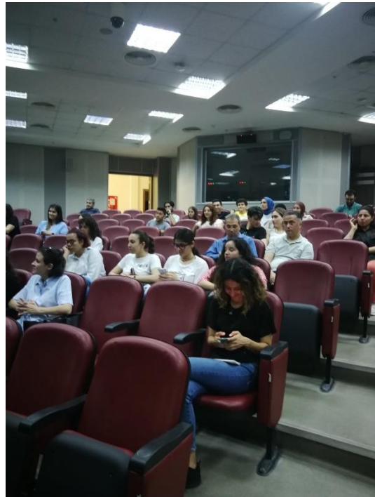
Előadás tartás az Akdeniz Egyetemen, és az előadások hallgatósága

Az Akdeniz University Törökország egyik legnagyobb egyeteme, amelyet 1982-ben alapítottak. A hallgatói létszám 70 ezer, az oktatói és nem oktatói munkavállalók létszáma meghaladja a 4