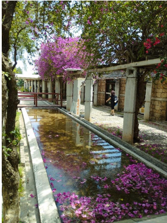
A campus egyik részlete

ezret. 24 kar, valamint 7 kutatóintézet működik az egyetem keretein belül. Az egyetemi épületek jelentős területen helyezkednek el a város nyugati részén. A campus egész területe nagyon kellemes környezetet biztosít a hallgatói és az oktatói munkához egyaránt.